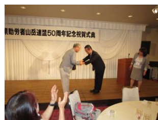
抽選会に当たって