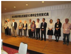
南部ブロック紹介で