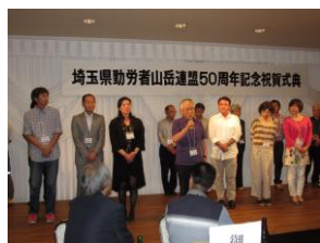
日進山の会の仲間