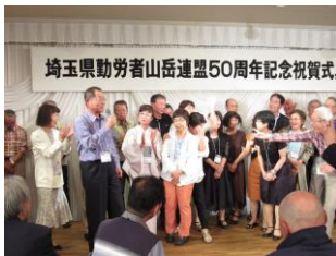
所沢ハイクの仲間