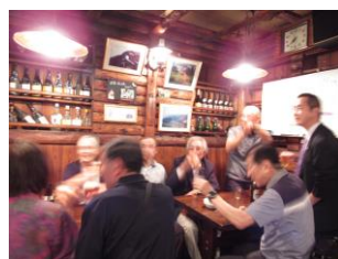
二次会は日和田アルパイン会員の居酒屋で