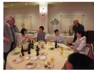
南部ブロックの宴席