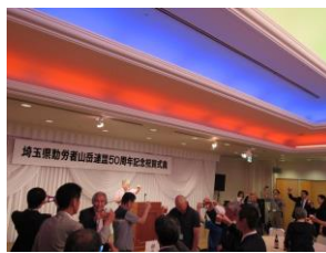
尾手事務局長 乾杯