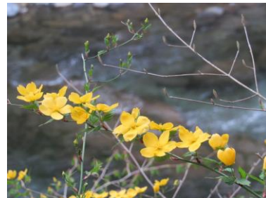
4/29 鳴虫山 含満淵で