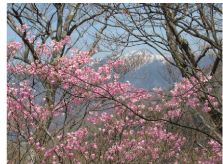
5/18 茶ノ木平遊歩道から白根山