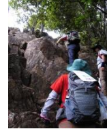
いよいよ岩場の急登