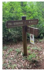
ゴミはほとんど無し