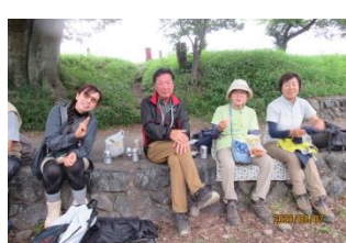
巾着田河原に到着