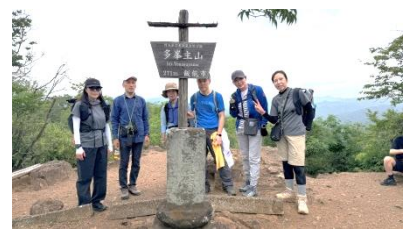
多峯主山山頂到着