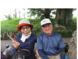
喉を潤した後は各会の報告とゴミ分別