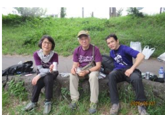
高麗峠を越えて巾着田河原に到着