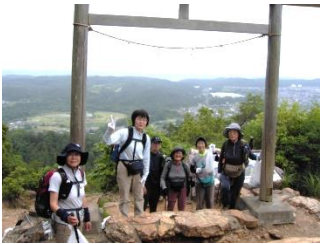
金刀比羅神社鳥居