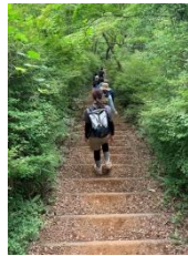
多峯主山をめざして