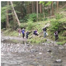
飯能河原から吾妻峡へ