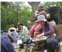
狭いながらも楽しい昼食