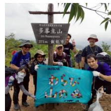
多峯主山山頂到着