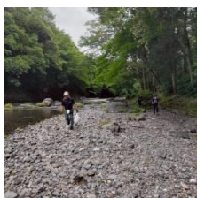
キャンプのゴミが目立つ