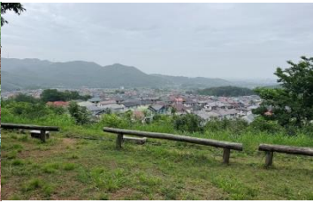
高麗登山口上から高麗の里