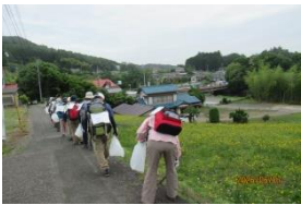
日和田山に向かう