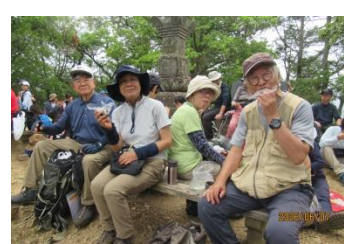
山頂での昼食風景