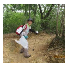
昼食を終えて下山