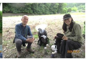
皆が巾着田河原に集合して、乾杯した後の昼食休憩・報告会