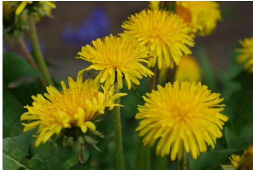
カントウタンポポ(在来種) 今では見かけるのも珍しく

なんとと言っても皆さんが一番によく見かけるタンポポはこのタンポポと違って過言ではありません。ヨーロッパ原産の帰化植物で、在来種に比較し種を作るしくみや開花期の長さや発芽しやすさ等の繁殖特性や生活力が強く、都会にも適応していると云えます。キク科の植物の特徴である多数の花（小花）が集まった花序（頭状花）の下にある、全体を包み保護する総苞と呼ばれるガクが長く反り返っています。小花の密度も高く、色が若干濃く感じます。